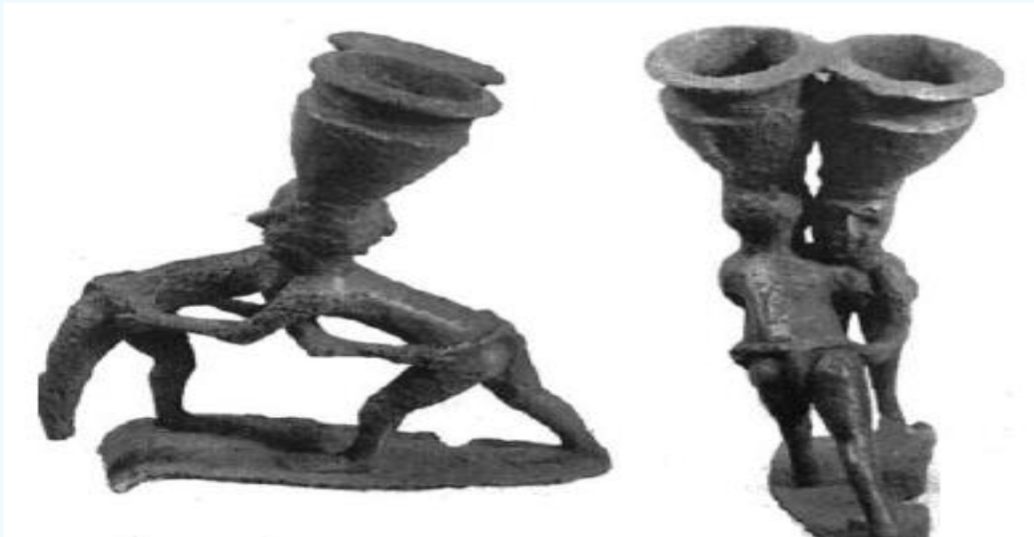
Resim 3. Güreşçiler: MÖ. 2600 yılları (Irak Bağdat Müzesi)

Kazılar, Sümerlerin boksla uğraştığını ve o dönemde boks tarihindeki en eski eldiveni kullandıklarını kanıtlamıştır. 2050 yıllarında Sümer döneminde güreş ve boksun inşinin başlangıcını temsil eden silindirik bir mühür Tell'te (Harmal) bulundu. MÖ 2000-1750 civarında olduğu tahmin edilen ve bir boks sahnesini temsil eden Babil dönemine tarihlenen bir çanak çömlek figürü de bulundu. Hayatta kalma mekanizması ve ilkel dayağın doğasının nasıl olup da özel ekipman kullanılan ve evrilen herhangi bir sporun gelişmesiyle avcılık ve savaştaki eğitim faaliyetlerine ve daha sonra "boks" gibi organize bir spora dönüşebileceğini hayal edebiliyoruz. Zaman içinde eskilerin bıraktığı edebi ve arkeolojik kanıtlar, çağlarda boks hakkında birçok ayrıntı sağladığından, bu sanat resmi, eski çağlarda boksun en eski resimlerinden biridir. Şimdi Irak'ta bulunan Tel Asmar, Ashnona'da bulunan kilden yapılmış bu duvar resminde ortaya çıktı. Bunun tarihi Duvar resmi, MÖ üçüncü veya ikinci binyılın başlarına kadar uzanır ve boks, eski bir kendini savunma sanatı ve yumruk atmada güç ve beceri, saldırı ve savunmada zeka gerektiren bir spor olarak bilinir. Boks insanlığın gelişyle birlikte ortaya çıktığı gibi, sanatın gücü yendiği bir spordu. İlk insan daha hayatının başında yürümeyi ve koşmayı öğrendi. İnsanın doğal savunma içgüdüleri sırasında, ilkel silahı keşfetmeden önce kendini savunmak için ellerine ve yumruklarına ihtiyacı vardı (Alwand vd., 2021: Farghali, 2018).