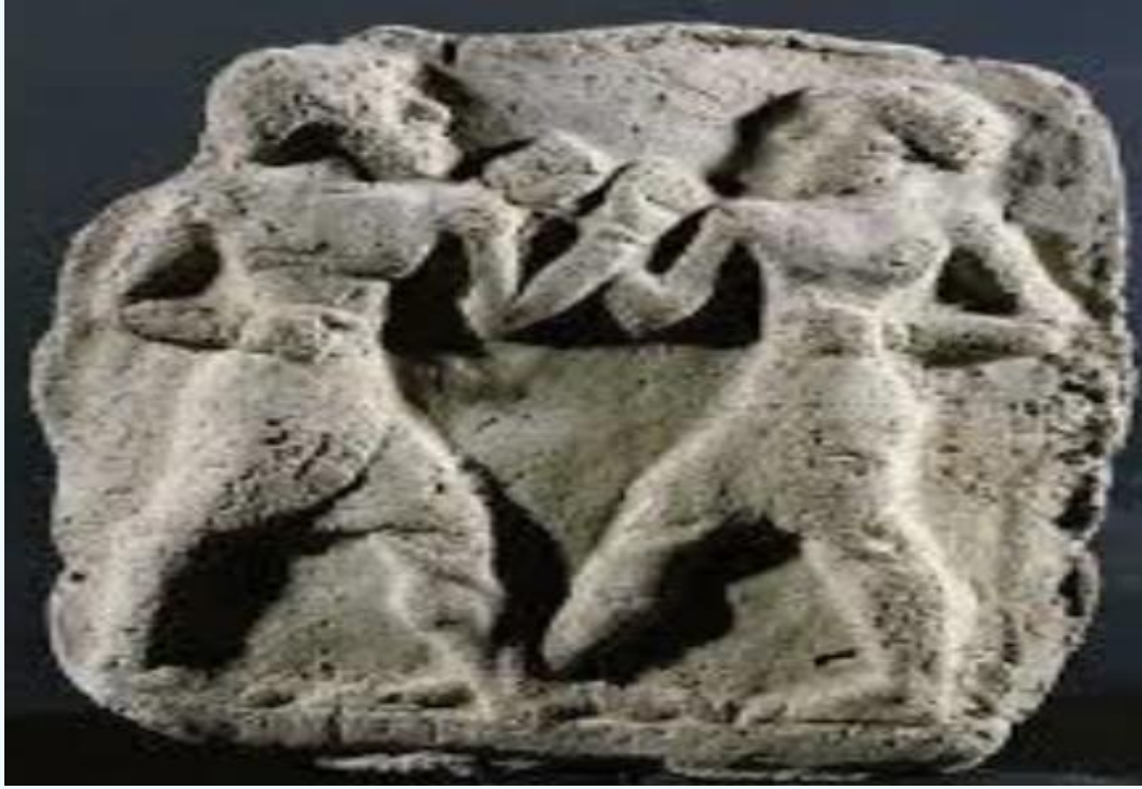
Resim 5. Boks: MÖ 2. Binyıl (Paris, Louvre Müzesi)

farklı hareketler yapıyor. Bu sanat eseri Kish dönemine kadar uzanıyor. Sporcuların hareketleri, farklı durumlarda belirgindi; sağdaki ilk sahne, atletleri fırlatmak için birbirlerine bakan ve birbirlerini kollarından tutan sporcuları gösteriyor. Her biri hareketlerini kısıtlamaya ve her birinin zayıf yönlerini keşfetmeye yol açtığı için bu sahne diğer iki sahneden daha güçlüdür. Önceki iki sahnede ise bazı güreşçilerin orta eğriliğini fark ediyoruz, bu da bir güreşçinin sonunu veya içlerinden birinin zaferini gösteriyor. Soldaki sahneye gelince, rakiplerden biri belirebilir ve diğerinin bacağına arkadan yakalayıp yere indirmek için sert bir yumruk atmış olabilir, burada hareketleri, darbeleri ve yapılan yumrukları fark ediyoruz. Spordaki (judo) el vuruşlarına benzer olabilir. Bu tekniğe (Kata-Juruma) denir ve Japon güreşinde bulunan (Karate) egzersizlerinde ve dövüş sanatlarında kullanılan bireysel bir eğitim sistemi anlamına gelir. Güreşi temsil eden sanat eseri, dikey, eğimli ve yatay eksenlerin konumunda temsil edilen, insanların birbirleriyle olan konumu, boyutu ve ilişkisi üzerinde görüldüğü için mutlak soyutlama sanatı ile karakterize edilmiştir. Maça gelince, her iki oyuncu da, oyuncuyu yere düşmesi durumunda kaybeden olarak kabul eden oyunun yasasına uygun olarak, dövüş sırasında diğerini yere düşürmeye çalışabilir (Alwand vd., 2021).