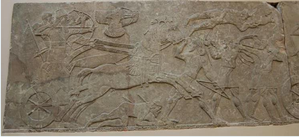
Resim 1. Savaş arabasıyla II. Aşurnasirpal ( https://www.worldhistory.org/image ).