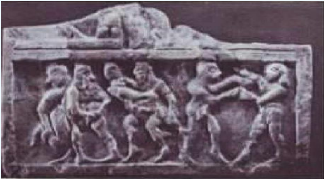
Resim 4. Güreşçiler: MÖ. 3000-2340 yılları (Irak Bağdat Müzesi)

Resim 4'de sanat eseri, güreş arenasına benzer bir yerde altı kişiden oluşan tapınakta (Ninto) (Khafaji) bulunan bir adak resmini temsil ediyor. Burada güreşçilerden her ikisi de