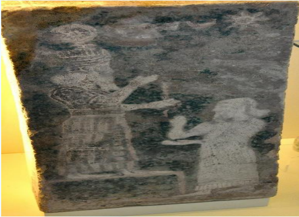
Resim 2. Güneş Tanrısı Şamaş ve dua eden adam( Bergamon Müzesi, Berlin), ( https://www.worldhistory.org ).